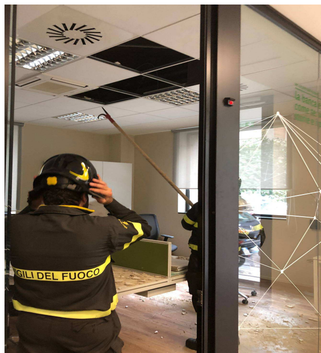
(Messina - Foto dei locali dell'Agencia Europa oggetto del crollo e dell'intervento dei Vigili del Fuoco)

Come ampiamente previsto e prevedibile, qualche ora fa si è letteralmente sfiorata la tragedia nei nuovi locali dell'Agencia Europa di Messina aperta al pubblico soltanto, udite udite, lo scorso 11 giugno.