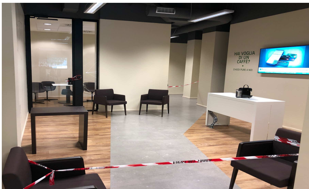
(Messina- Foto di un parte dei locali dell'Agazia Europa interdetti dai Vigili del Fuoco)

Contestualmente chiediamo ufficialmente un incontro con i vertici aziendali per affrontare, una volta per tutte, i temi della sicurezza e delle evidenti carenze strutturali, strumentali e funzionali dell'Agazia Europa di Messina.