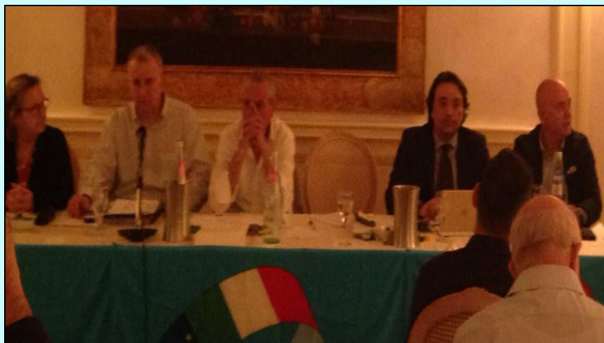
(A sx, il Tavolo della Presidenza del Consiglio di Coordinamento UILCA Gruppo BNL)